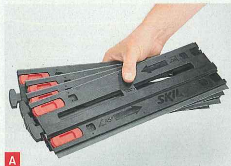
A Die vier Schienenteile können problemlos aufbewahrt und transportiert werden

Die Schiene finden wir genial – doch der primitive Adapter-schuh für die Säge wertet das System etwas ab