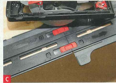
C Beim ersten Schnitt werden die überhängenden Seitenzungen entfernt